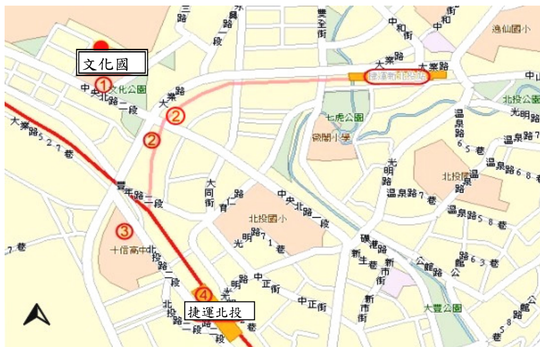
文化國小地圖及交通說明表格