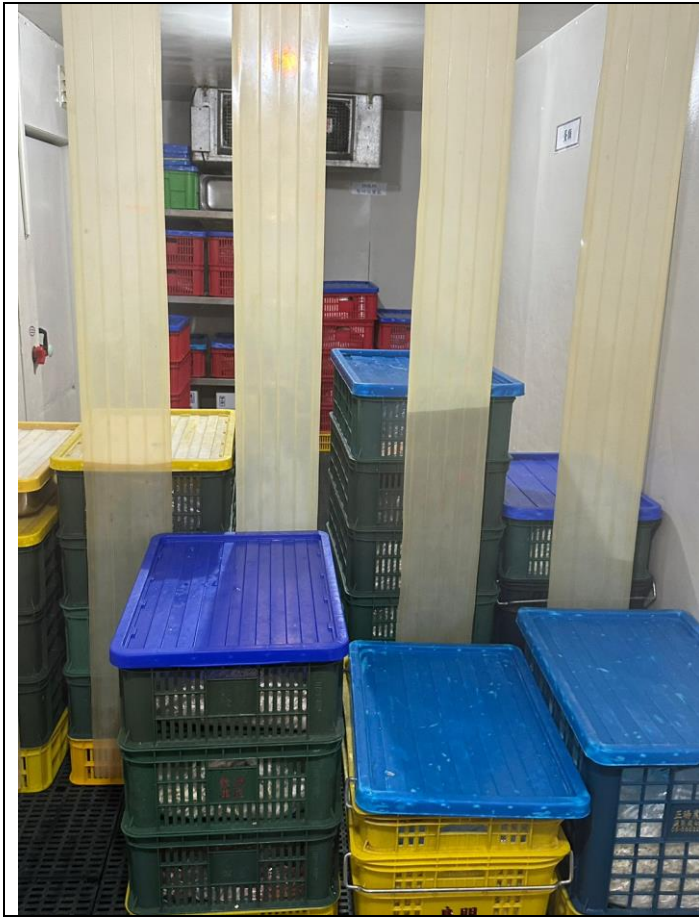
冷藏室內保持低溫，保持食材新鮮度，依規定離地架高，標明日期時間。