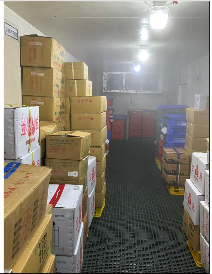
冷凍庫也有溫度控管，保持食材新鮮度，依規定離地架高，標明日期時間。