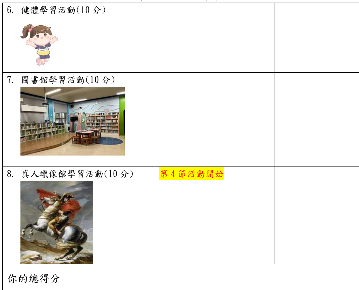
學習活動場地配置圖：